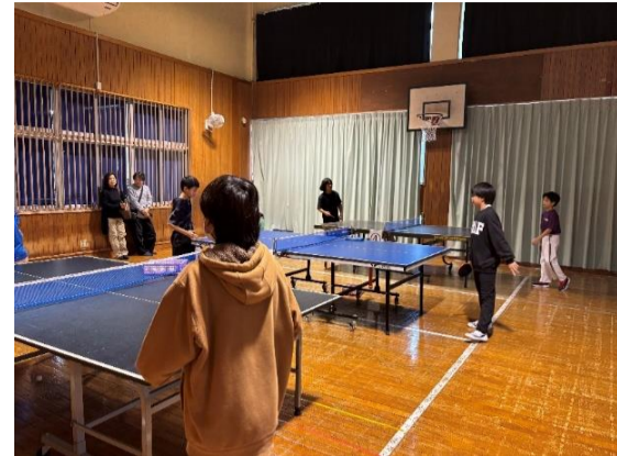
小祿児童館卓球交流