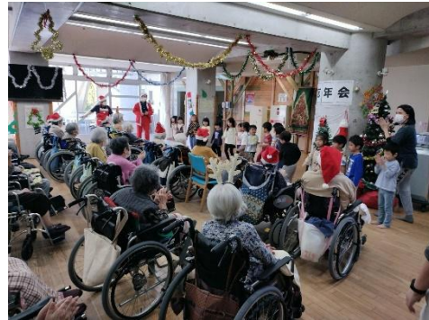
クリスマス忘年会