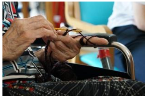
手工芸活動（ぬり絵、編み物）