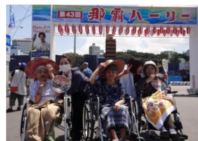
那覇ハーリー見学